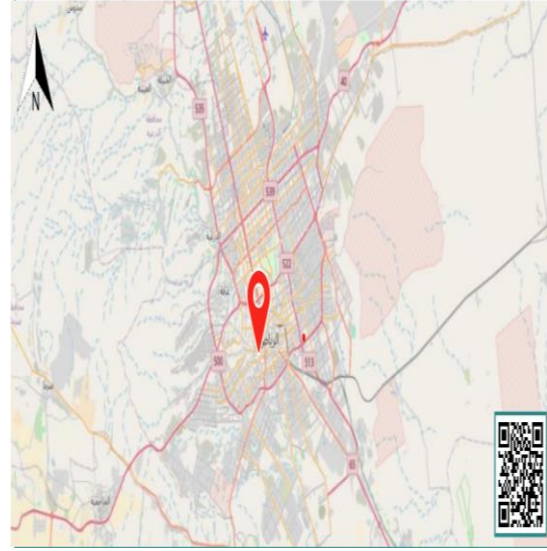
الموقع بالنسبة لمدينة الرياض