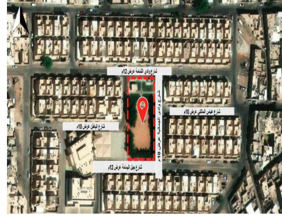
الموقع على المصور الجوي