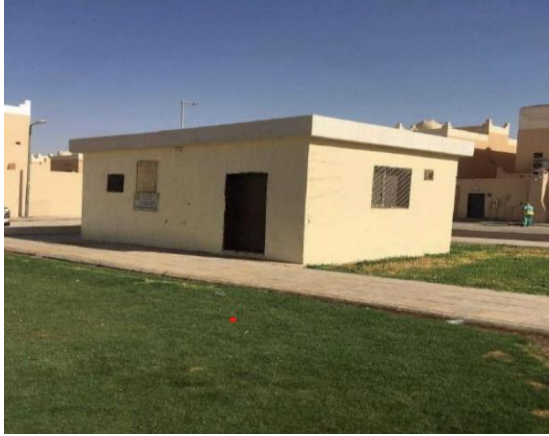
صورة الموقع على الطبيعة